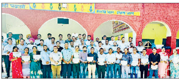
कैथल। एआई के प्रशिक्षण उपरांत प्रमाण पत्रों को दिखाते अध्यापक