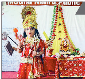
जीद। मोतीलाल स्कूल में माता रानी का रूप धरे हुए बच्चों।

मोतीलाल नेहरू पब्लिक स्कूल में बुधवार को माता रानी का भव्य आगमन हुआ। पूरे विद्यालय परिसर में भक्ति और श्रद्धा का वातावरण व्याप्त था। माता की प्रतिमा का ससम्मान स्थापना कर विधिवत पूजा व अर्चना की गई। माता के चरणों का पूजन कर समस्त विद्यालय परिवार ने उनके