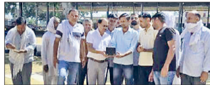
पाई। मंडी में धान खरीद करते एजेंसी के अधिकारी।

टेम्परेरी पास जारी करने के लिए अपने एंड्रॉइड मोबाइल फोन में प्ले स्टोर से हरियाणा ई खरीद ऐप डाउनलोड करके इसका प्रयोग कर सकते हैं। यह ऐप किसानों की सुविधा के लिए है। इससे किसान भाई इस ऐप में मेरी फसल मेरा ब्योरा पर रजिस्टर्ड मोबाइल नंबर एंटर करें