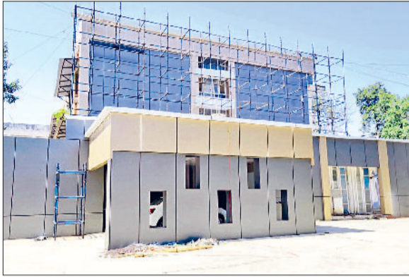
जींद। नागरिक अस्पताल की पुरानी बिल्डिंग को दिया गया लुक व पुरानी बिल्डिंग में बना रिसेप्शन।

बिल्डिंग में सीवरेज, लीकेज फायर सिस्टम सबसे बड़ी समस्या, बुधवार को पूरा दिन तैयारियों में जुटे रहे अधिकारी