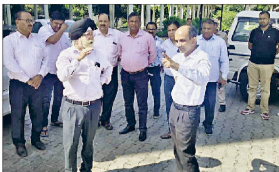
जीद। नागरिक अस्पताल में व्यवस्थाओं का जायजा लेते एसडीएम।

एसडीएम सत्यवान सिंह मान ने कहा कि 25 सितंबर को दीन दयाल लाडो लक्ष्मी योजना की एप का शुभारंभ होगा। जिला स्तरीय कार्यक्रम का आयोजन नागरिक अस्पताल में किया जाएगा। इस कार्यक्रम में हरियाणा विधानसभा के डीप्टी स्पीकर डा. कृष्ण लाल मिद्दा बतौर मुख्य अतिथि शिरकत करेंगे। मुख्यमंत्री नायब सिंह सैनी 25 सितंबर को पंचकूला में आयोजित प्रदेश स्तरीय कार्यक्रम से दीन दयाल लाडो लक्ष्मी योजना के मोबाइल एप का शुभारंभ करेंगे।