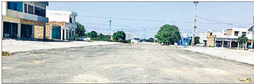
कैथल। मार्केटिंग बोर्ड द्वारा अनाज मंडी में बनवाई गई नई सड़क।

जिले की मंडियों का ढांचा कई वर्षों से जर्जर हो चुका था। आदतियों और किसानों की लगातार मांग थी कि मंडियों की